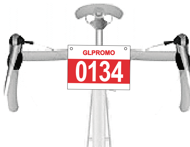
FRENTE AO GUIDÃO