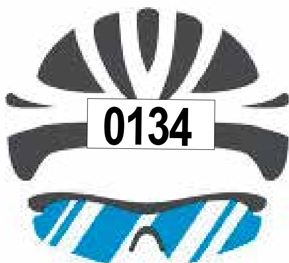
FRENTE DO CAPACETE